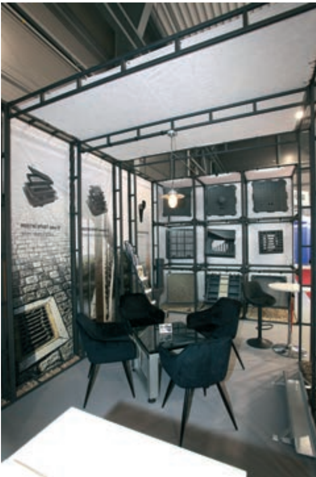
Expozice v kategorii do 30 m 2 Společnost: VLČEK SOLUTION s. r. o.

Výsledky soutěže byly vyhlášeny na slavnostním večeru 24. 5. Hodnotilo se ve třech kategoriích. V první zmiňované kategorii zvítězila expozice společnosti VLČEK SOLUTION s. r. o. V prostřední kategorii byly dle poroty nejlepší expozice dvě, a to společností SUEZ Water CZ s. r. o. a B & BC, a. s. V kategorii největších expozic si odnesli prvenství rovněž dva vystavovatelé: HAWLE ARMATURY, spol. s r. o., a VEOLIA ČESKÁ REPUBLIKA, a. s.