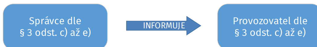
Obr. 1 Zjednodušené schéma informační povinnosti dle § 4a odst. 1

Novela zákona stanoví, že správce informačního nebo komunikačního systému kritické informační infrastruktury , anebo správce významného informačního systému , musí informovat provozovatele takového systému (tedy toho o kom na základě uzavřené smlouvy ví, že je orgán nebo osoba zajišťující funkčnost technických a programových prostředků tvořící konkrétní informační nebo komunikační systém), že se stává provozovatelem takového systému, a tedy, že se na něj nově vztahuje zákon (§ 4a odst. 1).