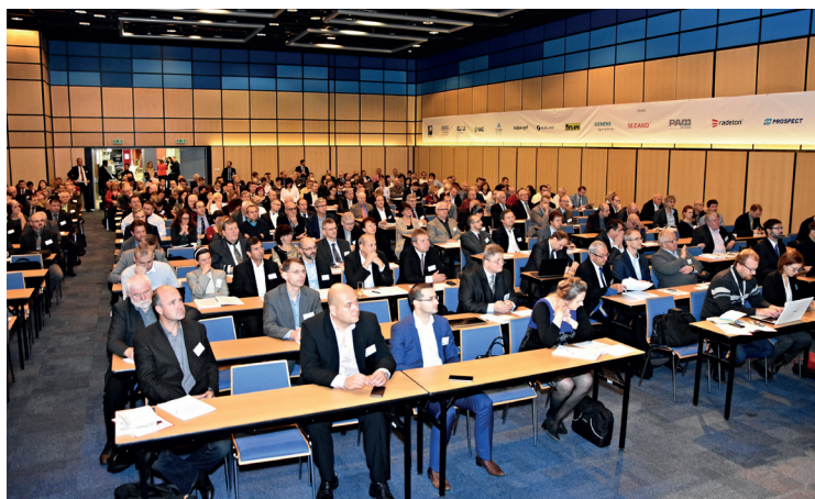
Záběry konference v Ostravě v roce 2017